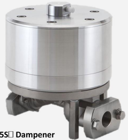
P25S□ Dampener 1" Connections SUS