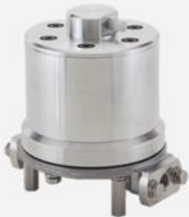
P10A□ Dampener 3/8" Connections Aluminum